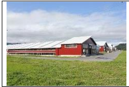
「尾花沢スカイファームおざき」